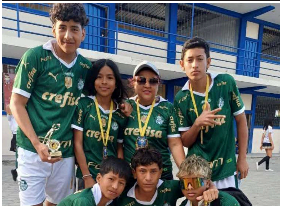
En la foto cinco jugadores varones y dos mujeres, que fueron parte del equipo campeón