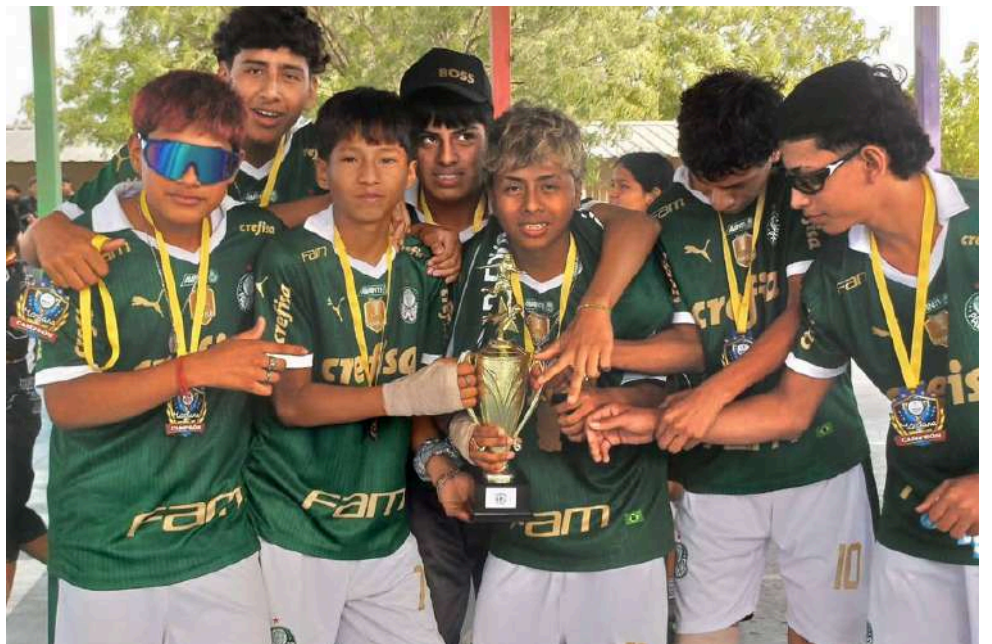
Jugadores del Décimo A mostrando el trofeo y sus medallas como campeones