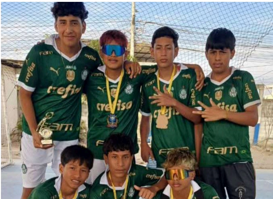
Décimo Año "A" fue el campeón de los Juegos Deportivos Internos de la UE Paquisha