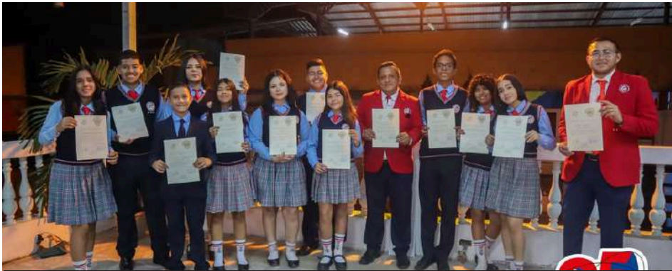
Integrantes de las Banda Musical de la U.E.P Teresa de Calcuta que recibió un reconocimiento de la A.D.A.M