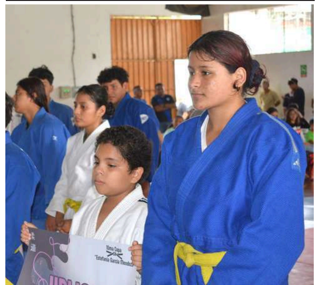
Judocas de diversos equipos, entre ellos El Oro, Jipijapa, Manta, Viejo Luchador y Portoviejo presentes