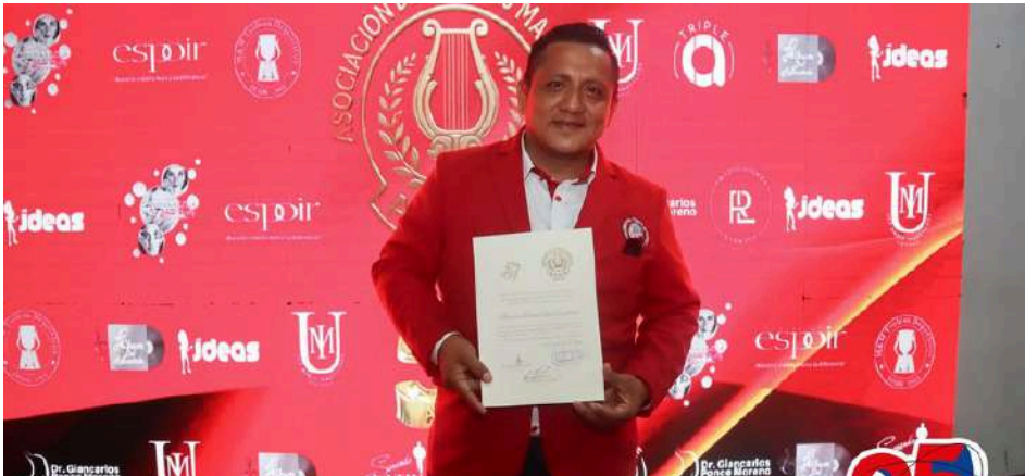
El Director de la Banda Musical de la U.E.P Teresa de Calcuta recibió un justo reconocimiento por su labor