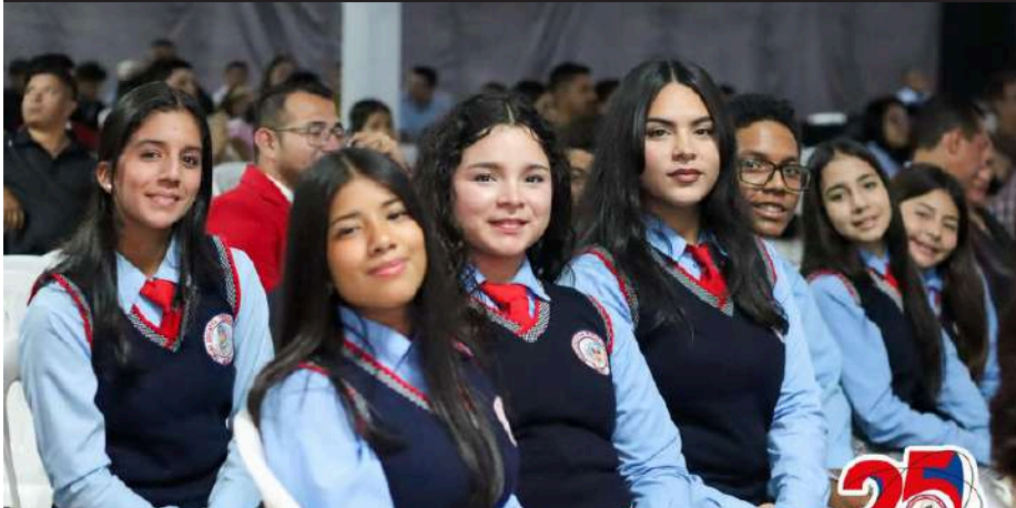
Un grupo de alumnos de la U.E.P Teresa de Calcuta presente en el evento realizado en la Casa de la Cultura de Manabí