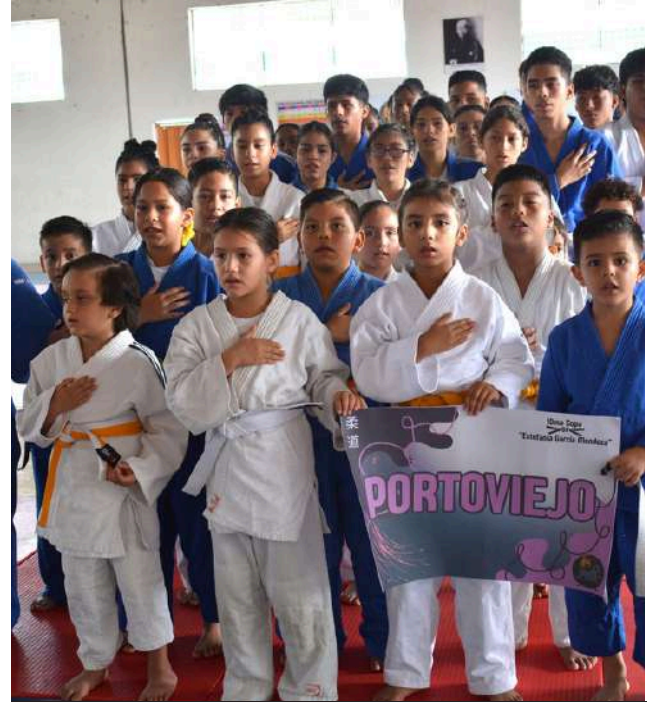
Portoviejo anfitrión de la Décima Copa de Judo "Estefanía García" 2025

La competencia no solo premia resultados; premia el carácter, la disciplina y ese espíritu combativo que nos mueve a seguir creciendo cada día. Pero, sobre todo, este evento sirve para confraternizar, para unir y crear lazos entre provincias, clubes y generaciones. Aquí fortalecemos la competitividad sana, de amistad y respeto.